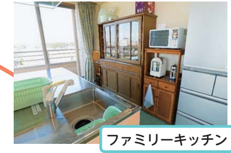
ファミリーキッチン